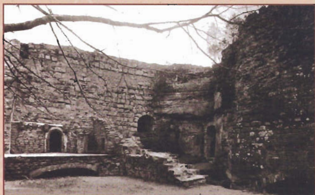
Ostseite der Schildmauer zu Beginn des 19. Jahrhunderts

Burg blieb in der Folgezeit im Besitz der Grafen von Löwenstein-Scharfeneck. Im Bauernkrieg 1525 konnten die aufrührerischen Bauernhaufen die schlecht verteidigte Burg einnehmen und zerstören. Der Wiederaufbau erfolgte bis 1530. Um die Mitte des 16. Jahrhunderts wurde die Burg noch einmal ausgebaut und die Wohnräume prächtiger ausgestattet. Die Burg war auch Amtssitz der Herrschaft Scharfeneck, zu dem einige Dörfer in der näheren Umgebung gehörten.