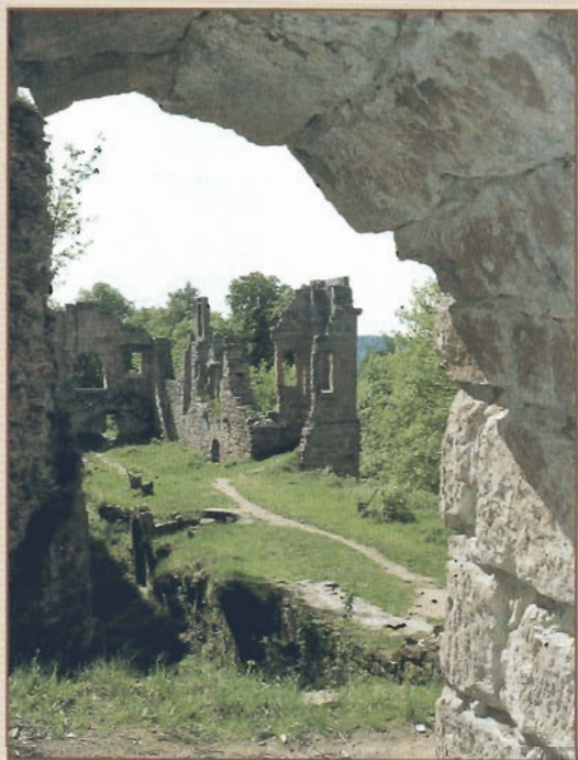
Blick in den Palas