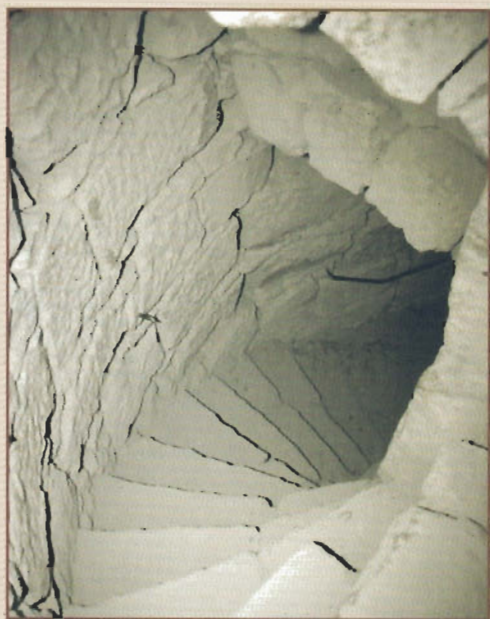
Verbindungsgang zwischen den Kasematten innerhalb der Schildmauer