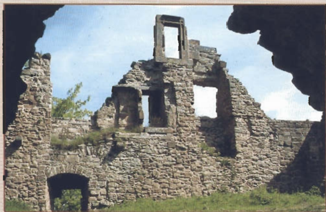
Blick von der Wächterkammer auf die Nordwand des Wohngebäudes

Martin Mobra, Am Hintertor 3, 76857 Eußertal