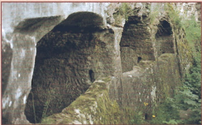
Zisternen im Burgbof