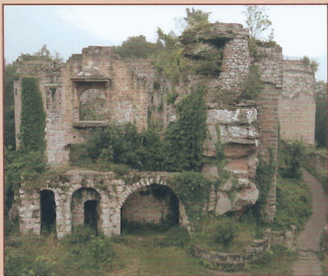
Blick auf die Hauptburg

Die Burg verfügte zur Wasserversorgung über eine Quellwasserleitung mit Burgbrunnen, einen in den Fels gehauenen Brunnen von ehemals 80 Metern Tiefe sowie über vier Zisternenbecken im inneren Burghof.