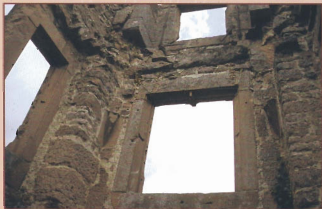
Der östliche Erker des Wohnbaus