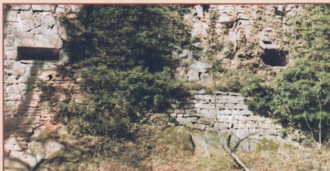
Geschützschießscharten in der Schildmauer